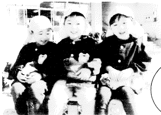
ひざに乗せた モルモット かわいいよ！

動物たちのかわいさとぬくもりに 子どもたちの優しい笑顔があふれ、 和やかな雰囲気が漂うひとときでした。