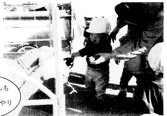
あひるさんも 先生とエサやり

差し出すエサをどんどん食べてくれるのが嬉しくなり、「もっとあげたい！」と喜んでエサをあげた子や、モルモットや犬に「かわいい！」と笑顔を向けて優しく触れ合った幼児さん。